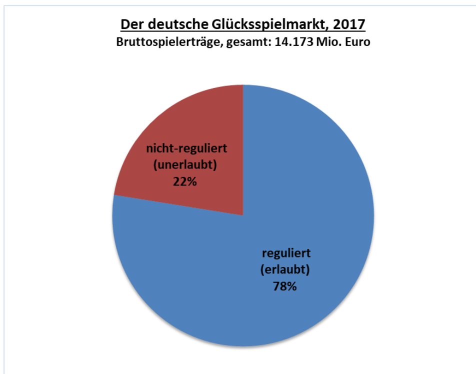
Abbildung 1: Der deutsche Glücksspielmarkt 2017